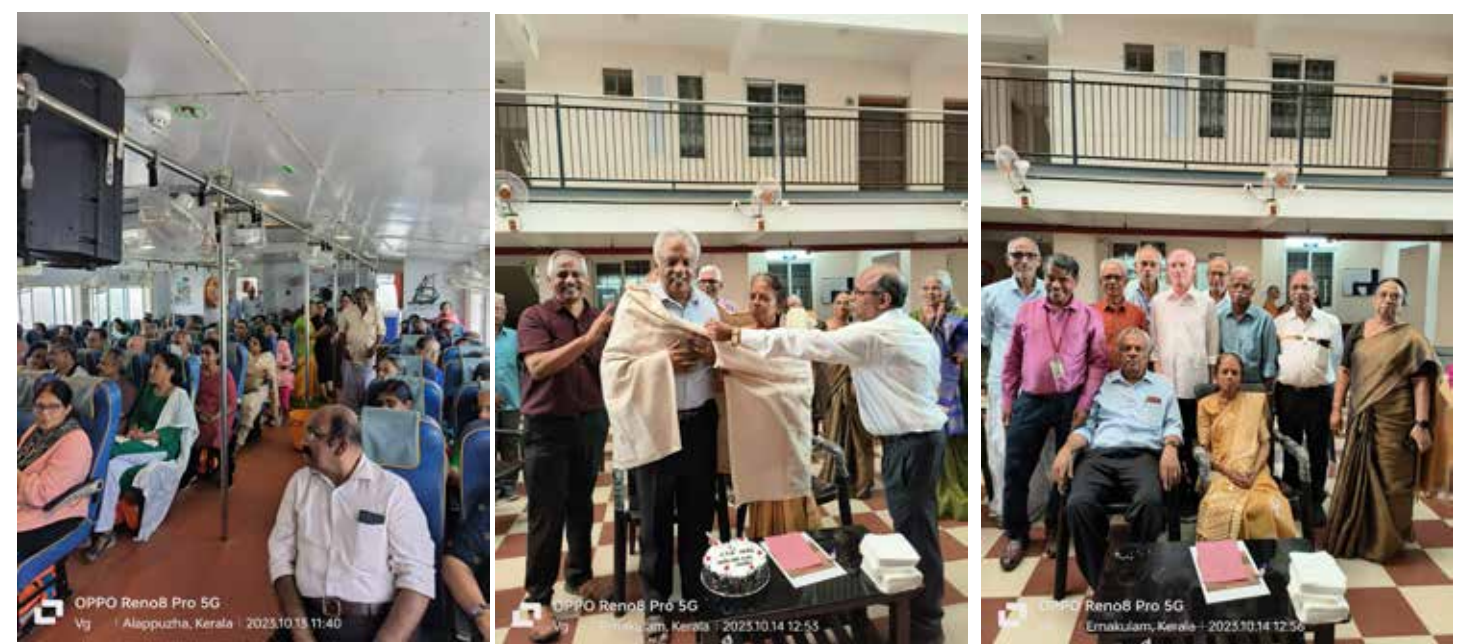
Enjoying the boat cruise